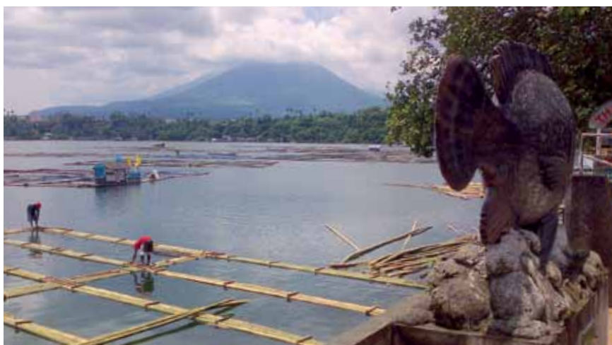
Fischzuchtkäfige im Sampaloc, dem größten der sieben Kraterseen.

Ausufernde Fischzuchten belasten die sensiblen Ökosysteme der sieben Seen. Deshalb hat der GNF sie zu den „Bedrohten Seen des Jahres 2014“ ernannt.