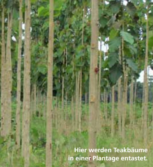
Hier werden Teakbäume in einer Plantage entsetzt.

Ihre Bestellung direkt per Telefon: 07732 9995-0