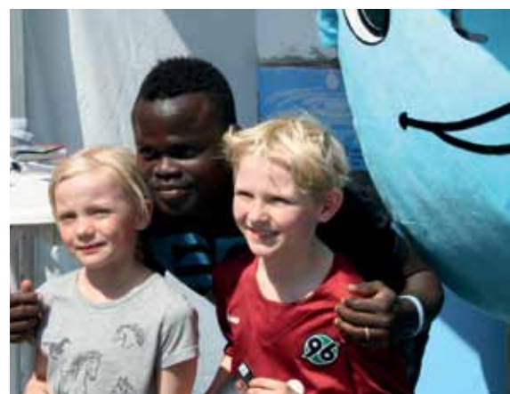
Fußballstar Didier Ya Konan kennt die Problematik in seiner Heimat.

Euro Pfand. Über 144.000 Euro kamen so bislang zusammen. Der Fandachverband „Rote Kurve“ unterstützt die Aktion. Außerdem sammeln die Läufer beim TUI Marathon Hannover – dieses Jahr kamen mehr als 4.000 Euro für das Hilfsprojekt zusammen, das auch der Veranstalter eichels:Event fördert.