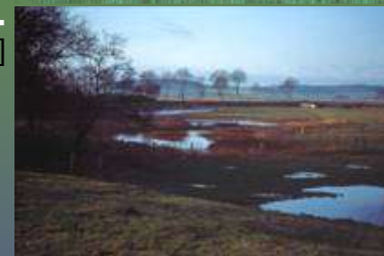
...Mares et mouillères, ... : Mares salées à Marsal [57]