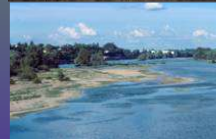
... et Vallées alluviales : la Loire à Orléans [45]