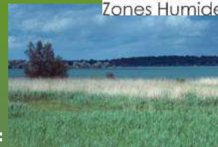
Un pôle-relais commun aux : Zones humides intérieures... : rives du lac du Der [51]