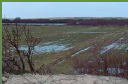
Marais littoraux de l'ouest : prairies inondables du Marquenterre [80]