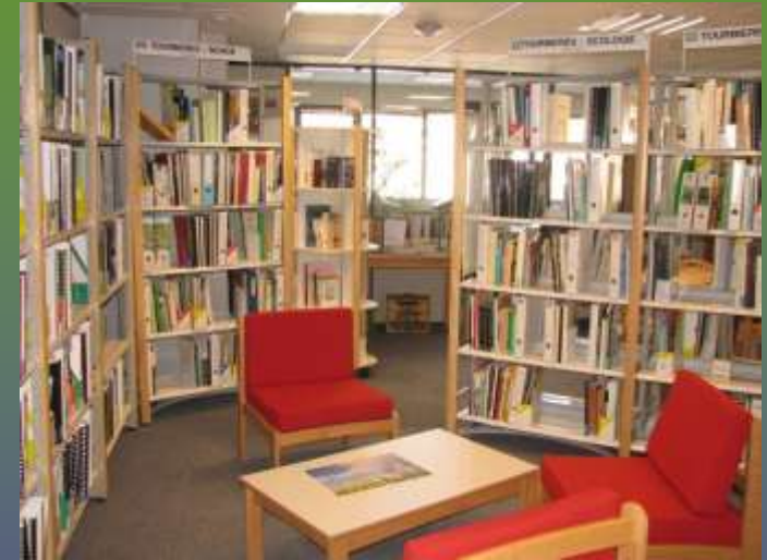
Centre de documentation