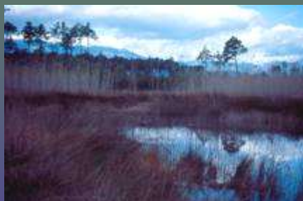
Lagunes méditerranéennes : marais de Cattolica, en forêt de Pinia [2A]