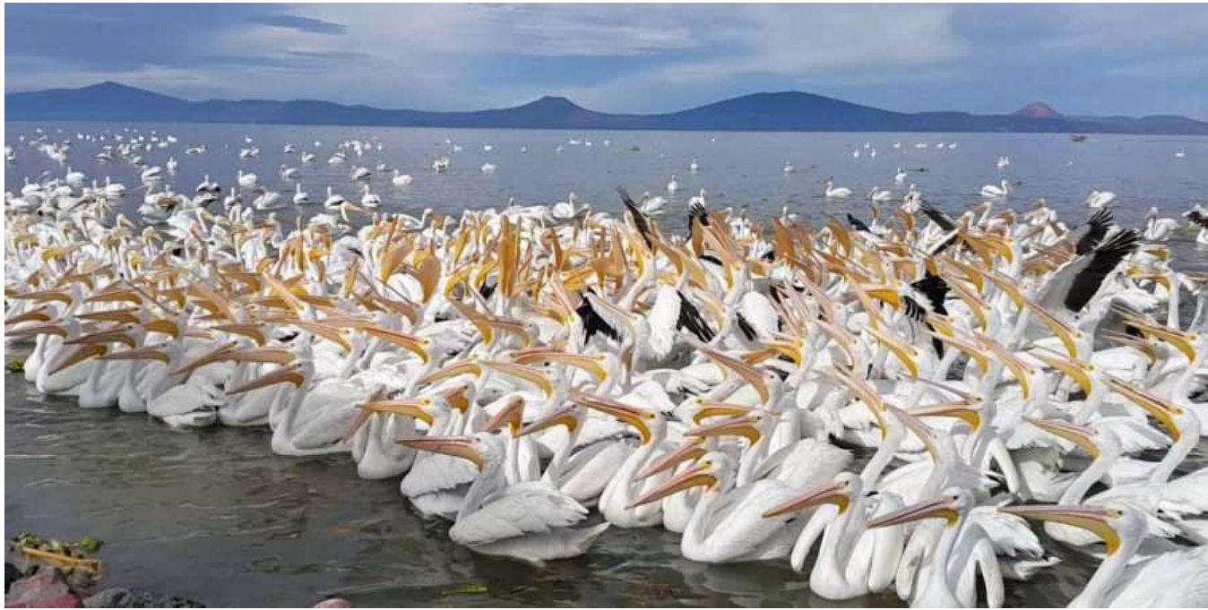
Pelicanos llegando al Lago de Chapala Jalisco México