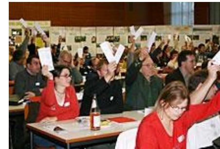
Naturschutz gesellschaftlich stärken