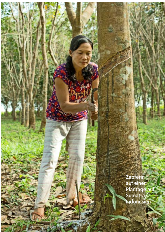
Zapferin auf einer Plantage auf Sumatra/ Indonesien

Wer die Wirksamkeit für Verbesserungen entlang der eigenen Lieferkette überprüfen möchte, kann dies nur zuverlässig tun, wenn Rückverfolgbarkeit bis zum Ursprungsort gewährleistet ist. So kann sichergestellt werden, dass der verwendete Naturkautschuk aus der Plantage stammt, in der eine Maßnahme durchgeführt wird bzw. bestimmte Kriterien gelten. Zertifizierungssysteme wie FSC, Rainforest Alliance und Fair Rubber haben hier Pionierarbeit geleistet. Viele arbeiten mit der so-