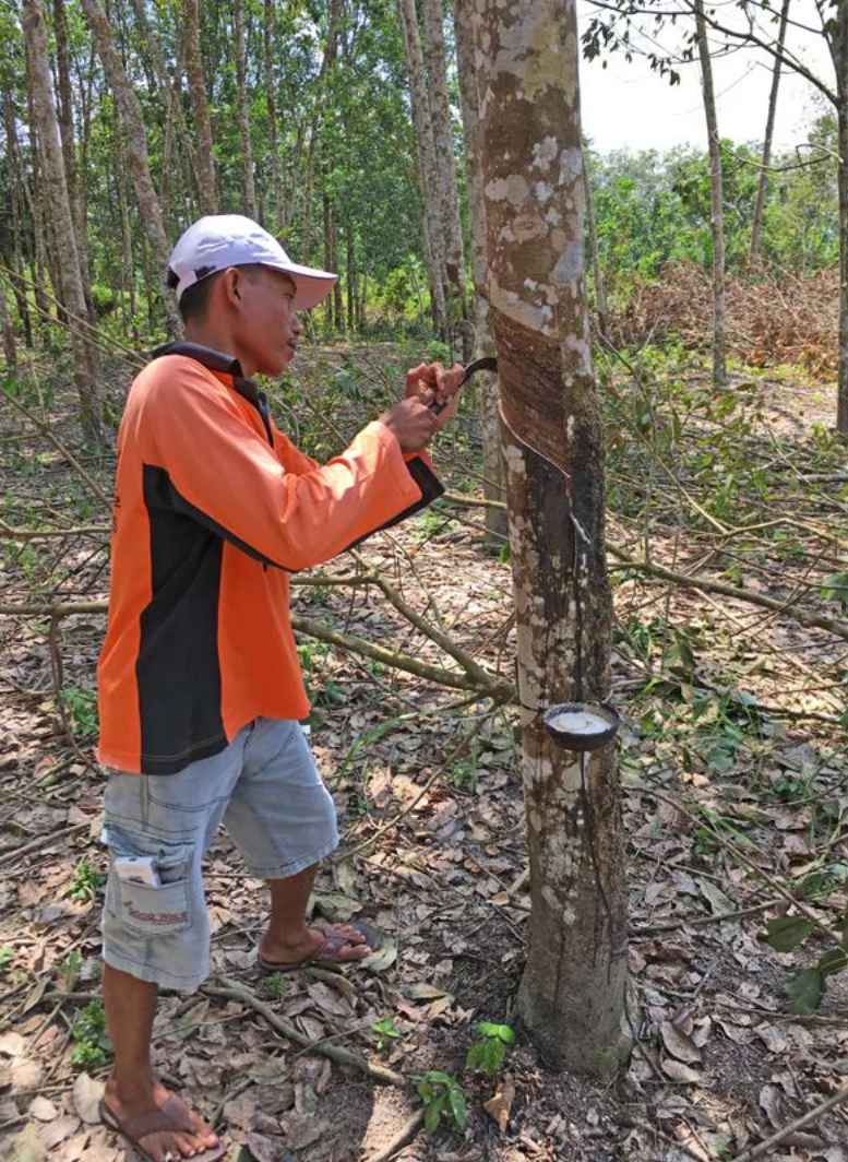
Um an den flüssigen Latex zu gelangen, werden die Kautschukbäume angeritzt.

FÜR EINE BESSERE WIRKSAMKEIT SIND REGEL- MÄSSIGE ÜBERPRÜ- FUNGEN VON ZENTRALER BEDEUTUNG.