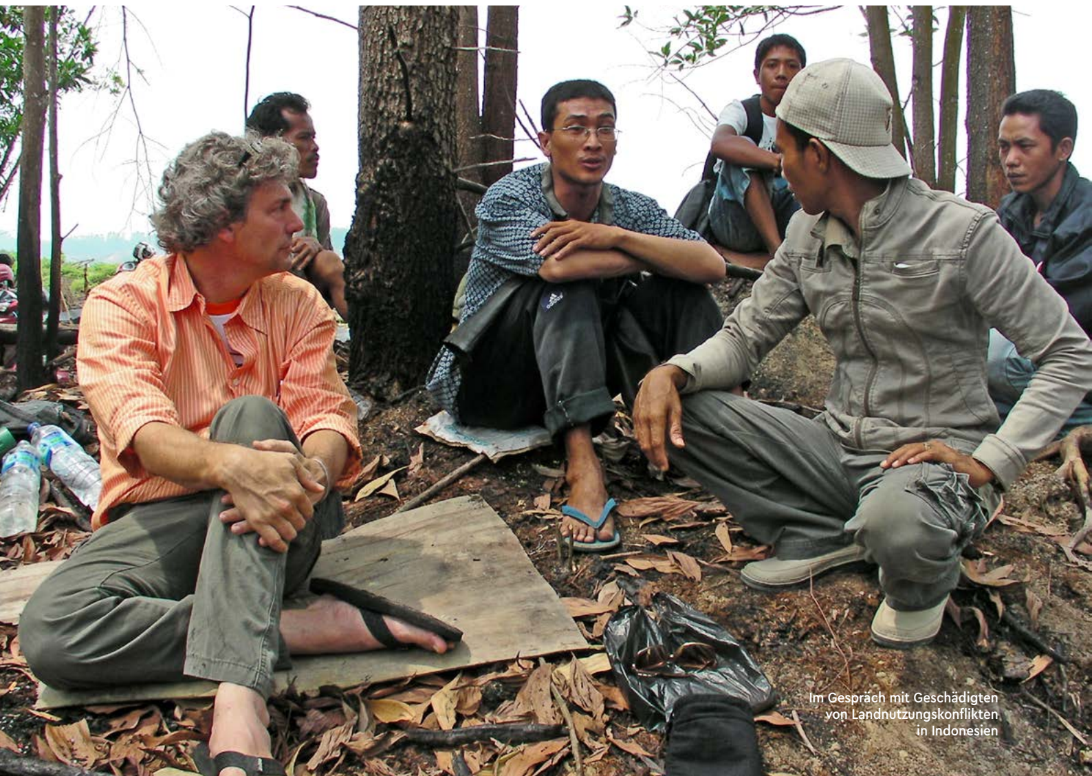
Im Gespräch mit Geschädigten von Landnutzungskonflikten in Indonesien