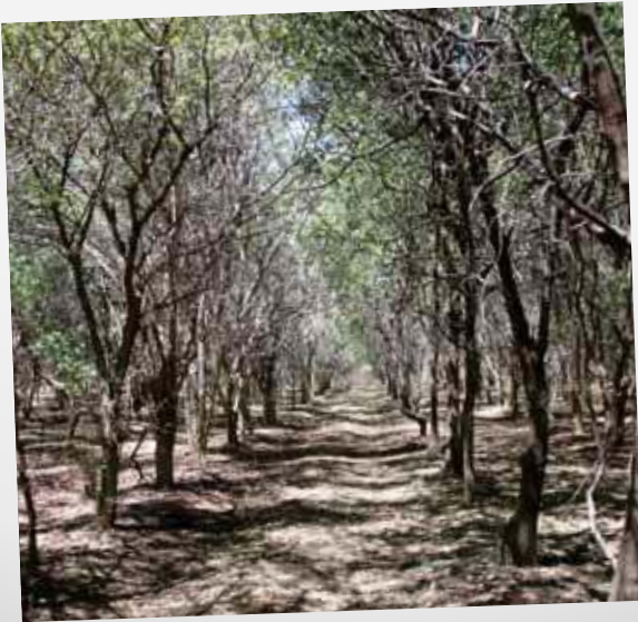
ANBAU VON INDISCHEM SANDELHOLZ