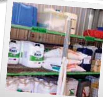
LAGERUNG VON HERBIZIDEN