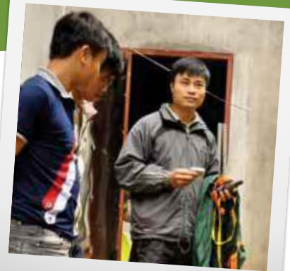
SCHULUNG IN ARBEITSSCHUTZ