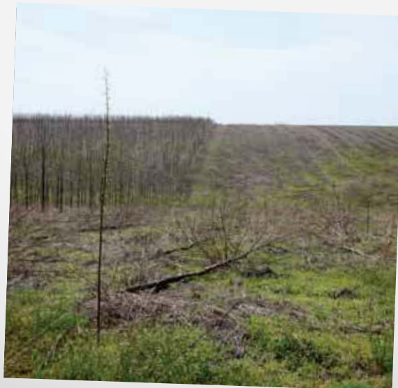
TEILERNTE PER KAHLSCHLAG

Zudem spielen viele Faktoren eine Rolle, wenn es darum geht, ein Waldinvestment aus ökonomischer Sicht zu bewerten. Waldinvestments sind mit großen Unsicherheiten und hohen Risiken behaftet. Für Menschen, die ihr Geld sicher und nachhaltig anlegen möchten, ist in diesem Bereich also die Einholung sehr detaillierter Informationen unabdingbar. Nicht nur aus Sorge um das gesparte Geld sollten potenzielle Anleger sich also genau überlegen, wie sie ihr Geld investieren.