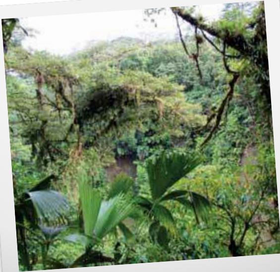
NATURWALD IN DEN TROPEN