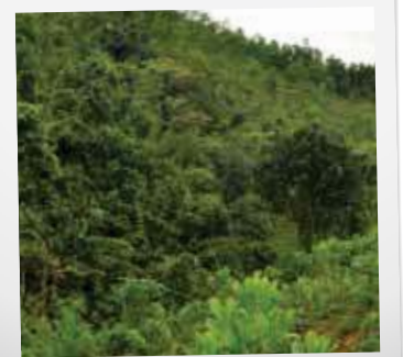
FORST MIT AKAZIEN-PFLANZUNG

Ein wichtiges Kriterium bei geschlossenen Fonds ist zudem, ob die zu bewirtschaftenden Flächen von Beginn an feststehen, oder ob es sich um einen „Blindpool“ handelt, bei dem diese erst im Nachhinein festgelegt werden. Zur Einschätzung der Chancen und Risiken eines Investments ist es natürlich vorteilhaft, wenn diese schon von Anfang an ausgewählt sind.