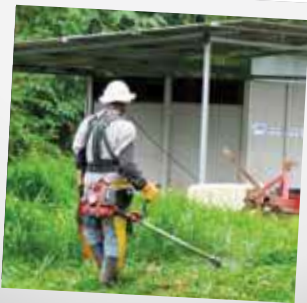
ARBEITER MIT SCHUTZKLEIDUNG

Die Arbeitsbedingungen innerhalb der Anlageprojekte vor Ort entsprechen bei allen untersuchten Fällen nationalen gesetzlichen Vorgaben. Internationale Arbeitnehmerrechte werden eingehalten, womit zum Beispiel auch Kinderarbeit ausgeschlossen ist. Die Festangestellten sind entsprechend sozial-, renten- und krankenversichert. Saisonarbeiter müssen sich in der Regel selbst versichern.